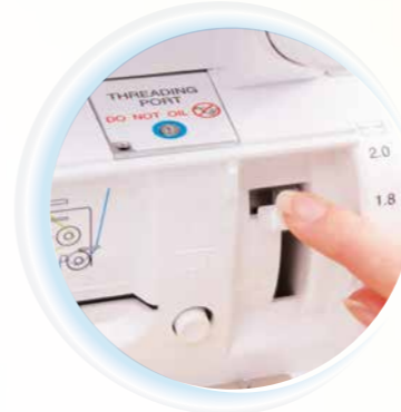
Jet-Air Threading™ System 1993 von baby lock entwickelt